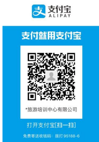
浙江旅游培训中心支付宝缴费二维码

原则上满 30 人开班，每个工种等级需 10 人（含）以上开考。人数不到，顺延至 2020 年 10 月 24 日鉴定（网上报名时间另行通知）。